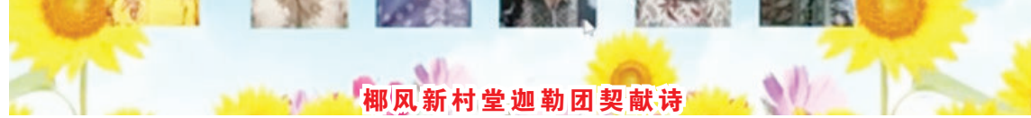
椰风新村堂迦勒团契献诗

的。圣经说这是奥秘也是得胜。林前 15:10-11“我们今日成了何等人,是蒙上帝的恩才成的,并且祂所赐我的恩不是徒然的。我比众使徒格外劳苦;这原不是我,乃是上帝的恩与我同在。不拘是我是众使徒,我们如次传,你们也如此信了。”